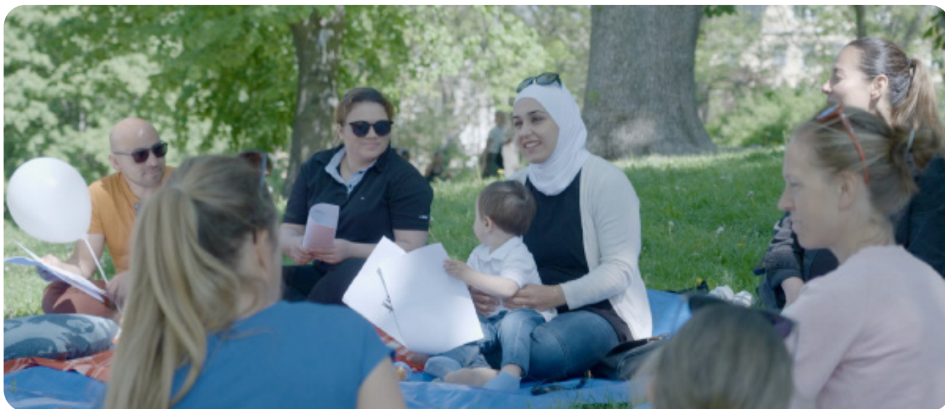
Deltagare och gruppleddare i Kungsholmen VT21.

Statistik 2021 Antal veckoträffar: 271 Antal besök: 4164