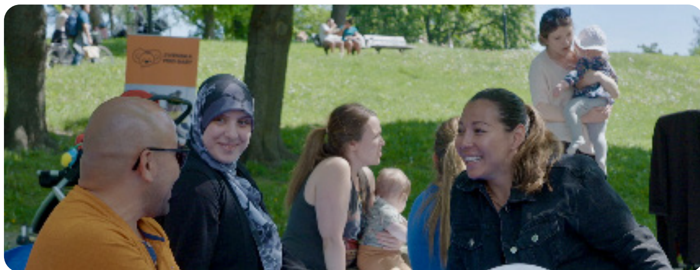
Deltagare och gruppleddare i Kungsholmen, Stockholm, VT21.