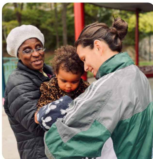
Många fina möten mellan vuxna och barn i Rågsved VT21.

År 2021 hade vi 19 aktiva grupper runt om i landet. Antal besök har ökat i år, dock har vi varit tvungna att ställa in några träffar på grund av rådande pandemi och RS viruset.