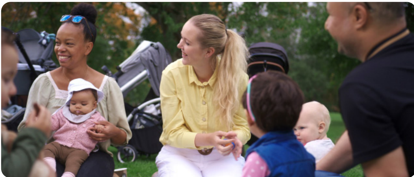
Bild från höstkampanjen Svenska med baby gjordes tillsammans med Öppna dörren i samarbete med Åhléns, HT21.

Ensam är inte stark. Svenska med babys uppdrag är att skapa möten och inkludering – och det gör vi i samarbete med ideella, offentliga och privata aktörer.