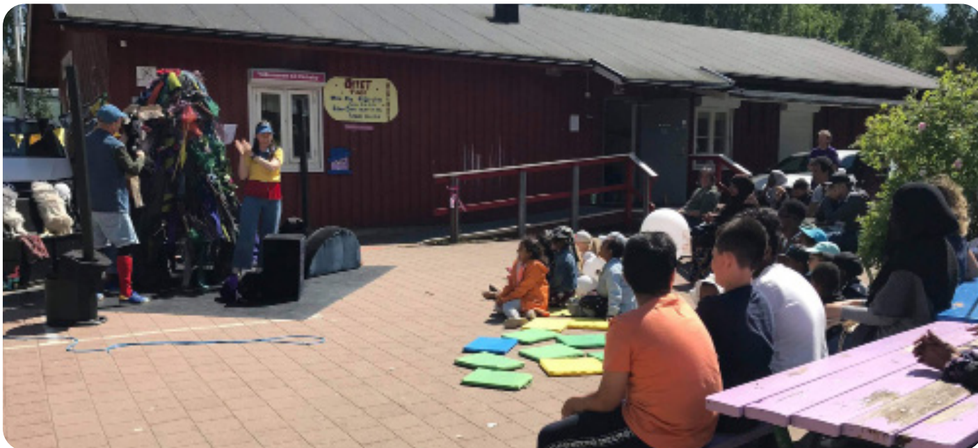
Besök av Dockteatern Tittut på familjelördagen i Rinkeby, HT21.

Under 2021 beviljades vi igen stöd från Socialstyrelsen med anledning av att boende i Järvaområdet drabbats extra hårt av covid-19. Svenska med baby och Rinkeby folkets hus har kunnat öka antalet familjelördagar i Rinkeby och ge barnfamiljer en återkommande aktivitet för hela familjen, för att öka välmående i en annars ansträngd vardag.