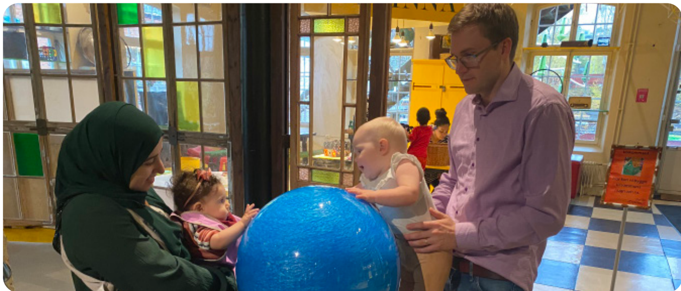
Besök hos Tom Tits i samarbete med Länsstyrelsen Stockholm och Södertälje Kommun HT 21.

Statistik 2021 Antal aktiviteter: 6 Antal besök: 138