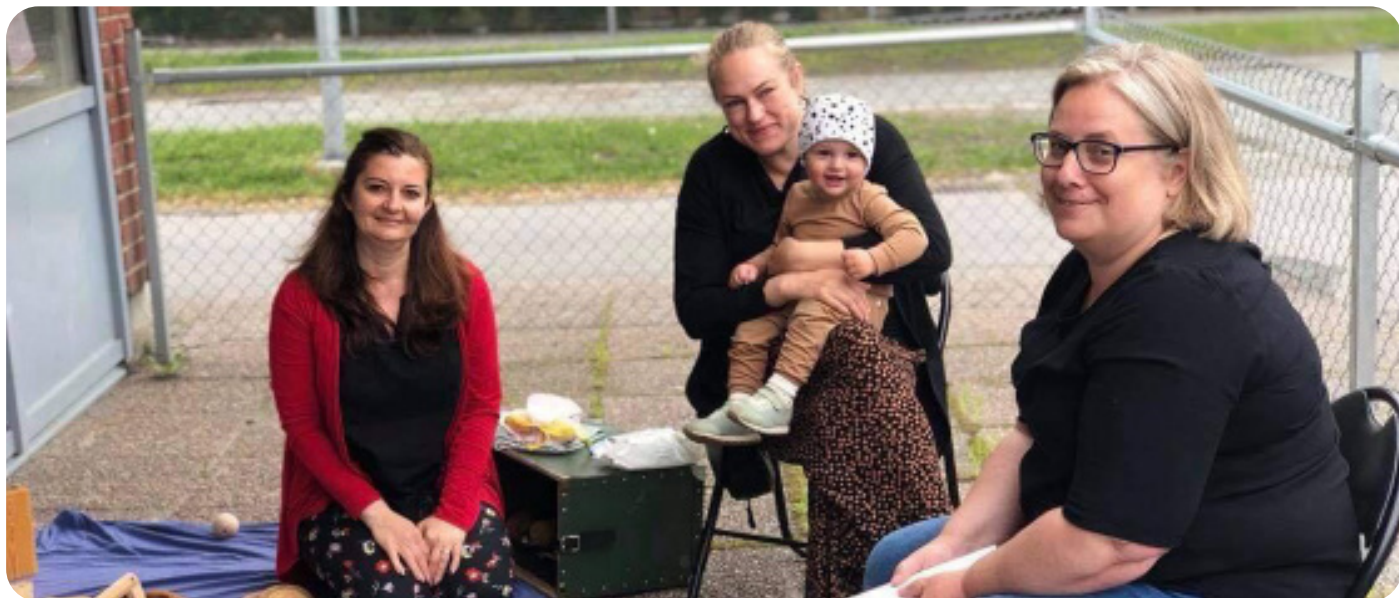
Gruppledare och medarrangörer för föräldragruppen i Södertälje, VT21.