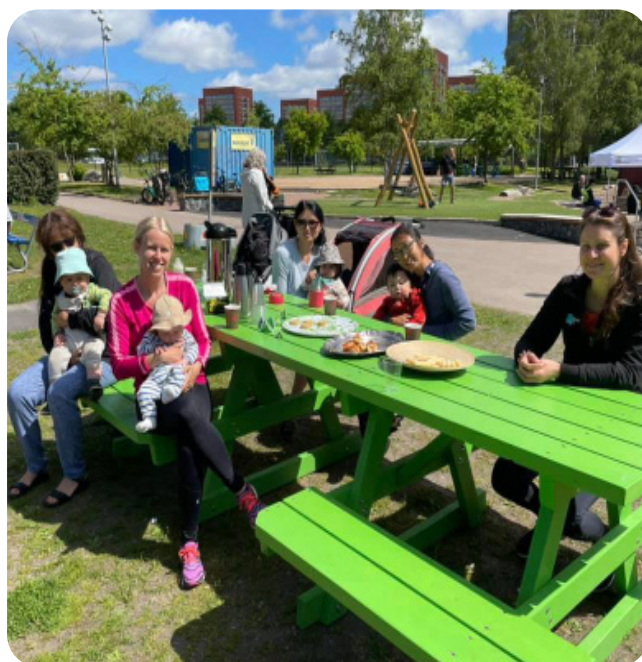
Sommarträff i Västra frölunda, Göteborg, VT21.

Vi har även haft tre sommarträffar i Göteborg.