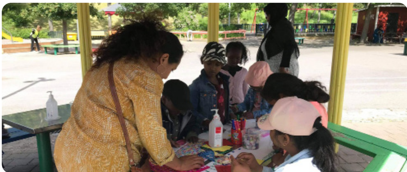
Pyssel och skoj på sommarträffen i Rinkeby, VT21

Statistik 2021 Antal sommarträffar: 8 Antal besök: 83