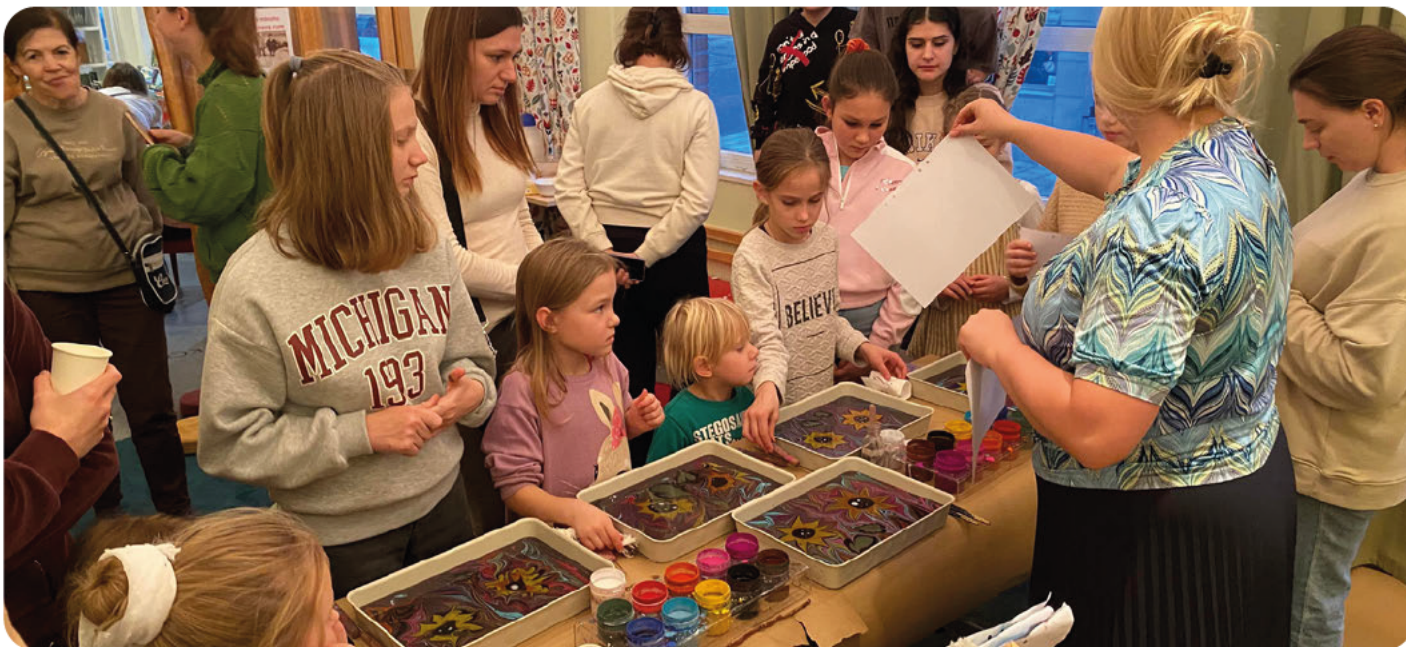
Måleri workshop med ukrainska barnfamiljer i Sollentuna, HT22.

Efter Rysslands invasion av Ukraina har Svenska med baby, liksom andra aktörer, mobiliserat för att möta den nya målgrupp av framför allt kvinnor och barn som flytt till Sverige från Ukraina. Det har varit centralt att erbjuda en trygg plats för lek och umgänge där barnen har fått chans att vara barn, och vi är glada att vi har kunnat erbjuda den platsen med stöd från TIA (Länsstyrelsen) och MUCF.