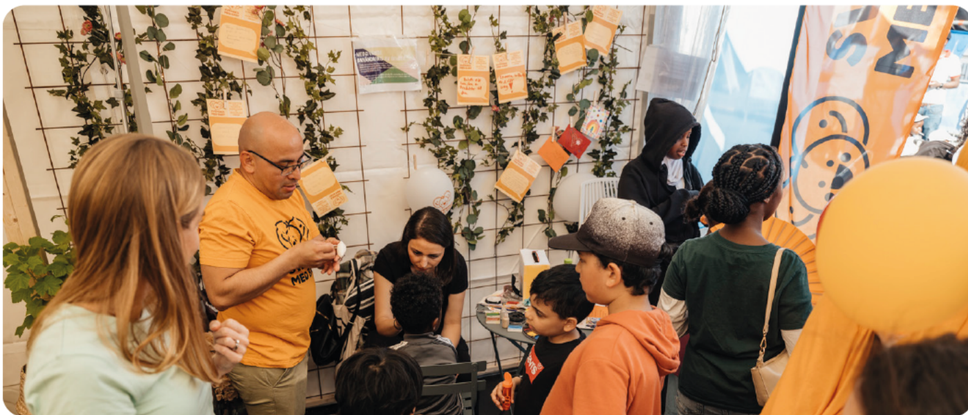
Bild från Järvaveckan Svenska med baby tillsammans med Öppna dörren, Sommar 2022.

Ensam är inte stark. Svenska med babys uppdrag är att skapa möten och inkludering – och det gör vi i samarbete med ideella, offentliga och privata aktörer.