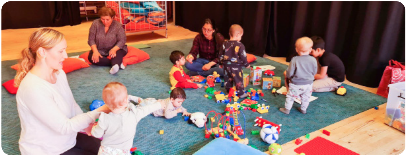
Deltagare och gruppleddare, Stockholm, VT22.