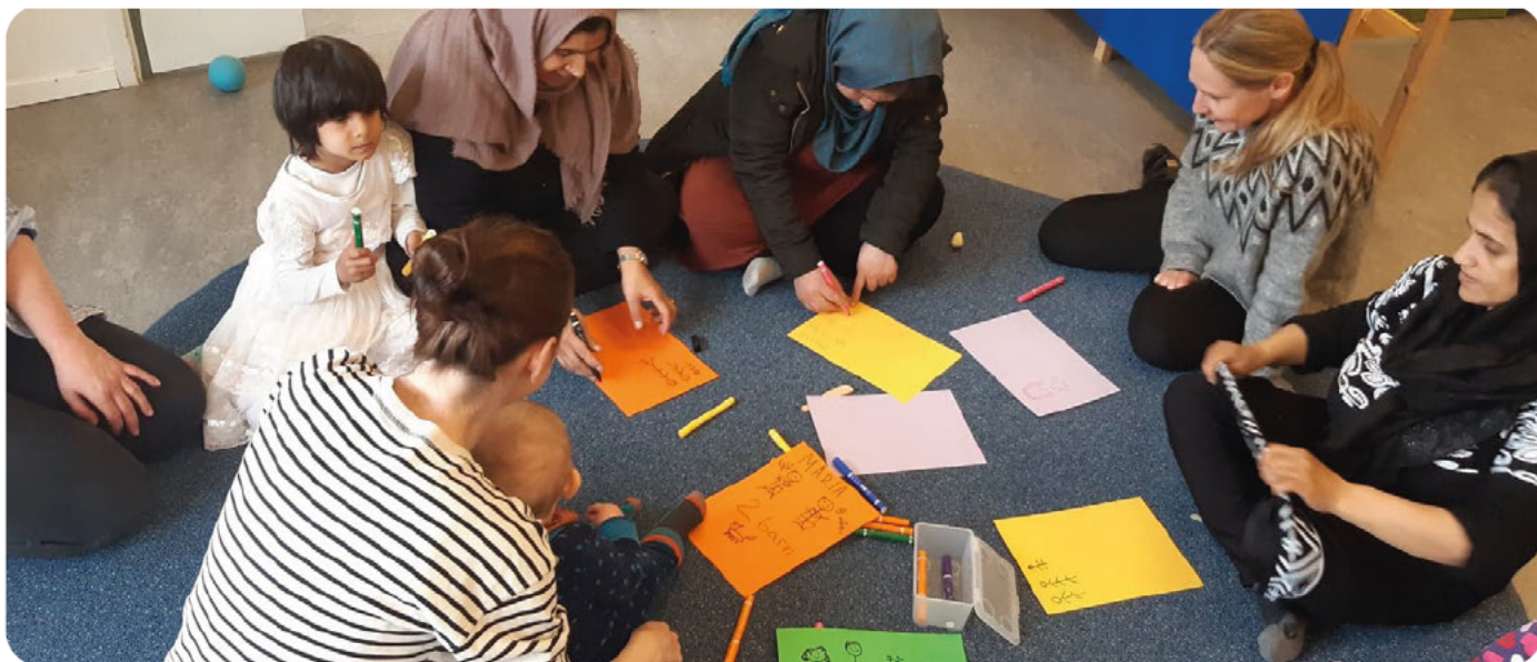
Deltagare och gruppleddare i Bromma VT22.

Till Svenska med babys öppna föräldragrupper är alla föräldrar med barn mellan 0 - 2 år välkomna. Föräldragrupperna äger rum på bibliotek, öppna förskolor, familjecentraler och i kyrkor samt utomhus i parker på 19 orter runt om i Sverige.