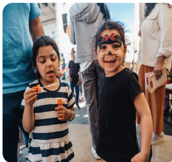
Glada barn på Svenska med babys tält på Järvaveckan 2022.

Tillsammans med våra ideellt engagerade volontärer och i samarbete med offentliga och privata aktörer engagerar och mobiliserar vi tusentals föräldrar och barn i glädjefyllda, jämlika möten för det öppna och inkluderande samhället. Det är vi stolta över!