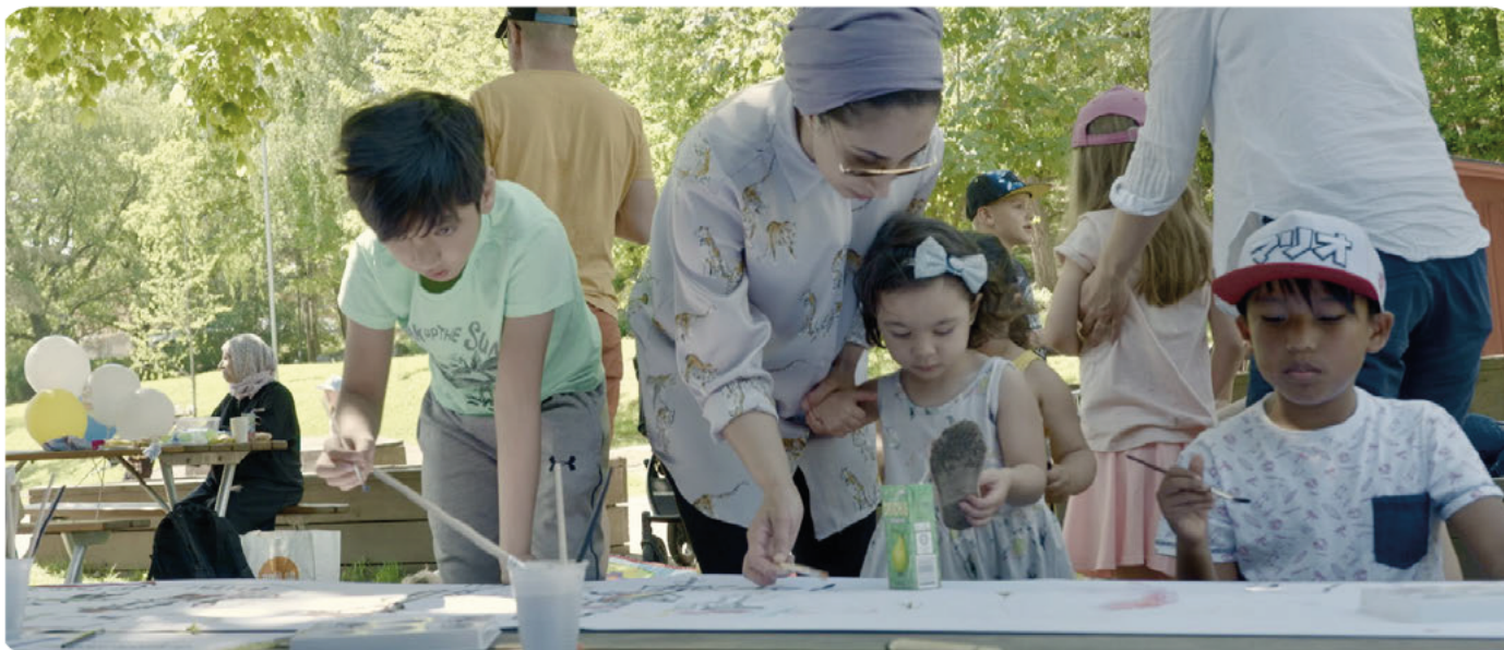
Härlig familjelördag fylld av glädje och gemenskap i Rågsved.

Statistik 2022 Antal Familjelördagar: 11 Antal besök: 392