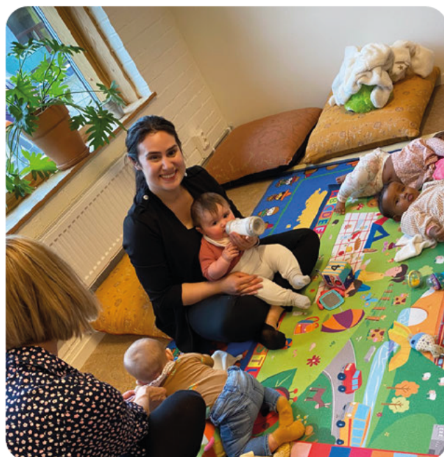
Många fina möten mellan vuxna och barn i Angered VT22.

Statistik 2022 Antal veckoträffar: 385 Antal besök: 6467