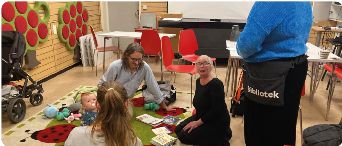
Gruppledare och medarrangörer för föräldragruppen i Skärholmen.